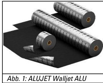
Abb. 1: ALUJET Walljet ALU

Produktbeschreibung ▶ Die ALUJET Walljet ALU besteht aus einem Aluminium-Verbundschichtaufbau und wird eingesetzt im Bereich der waagerechten Abdichtung in und unter Wänden gegen aufsteigende Feuchtigkeit bzw. Baufeuchte im Sinne der DIN 18533-1 Klasse W4-E.