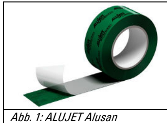
Abb. 1: ALUJET Alusan