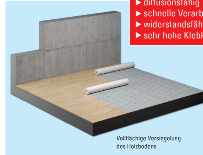
Vollflächige Versiegelung des Holzbodens