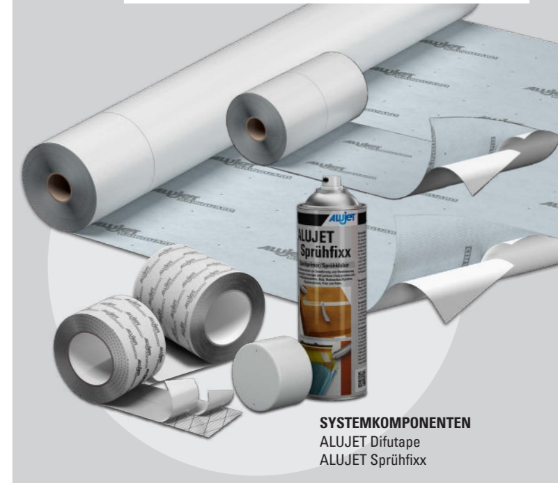
SYSTEMKOMPONENTEN ALUJET Difutape ALUJET Sprühfixx